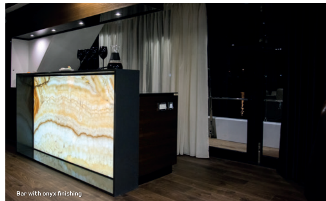
Bar with onyx finishing