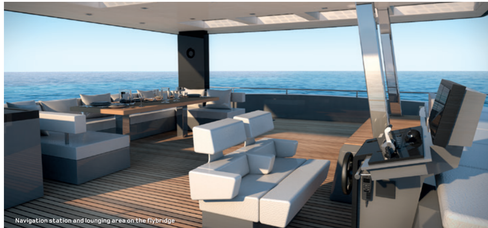
Navigation station and lounging area on the flybridge

La structure novatrice du Sunreef Supreme 68 comporte un immense flybridge recouvert d'un élégant bimini. Ce vaste espace de 65 m 2 peut être équipé d'un bar, de larges sofas, de tables et de matelas bain de soleil. La terrasse avant du yacht favorise la détente avec des larges matelas et peut accueillir un Jacuzzi.