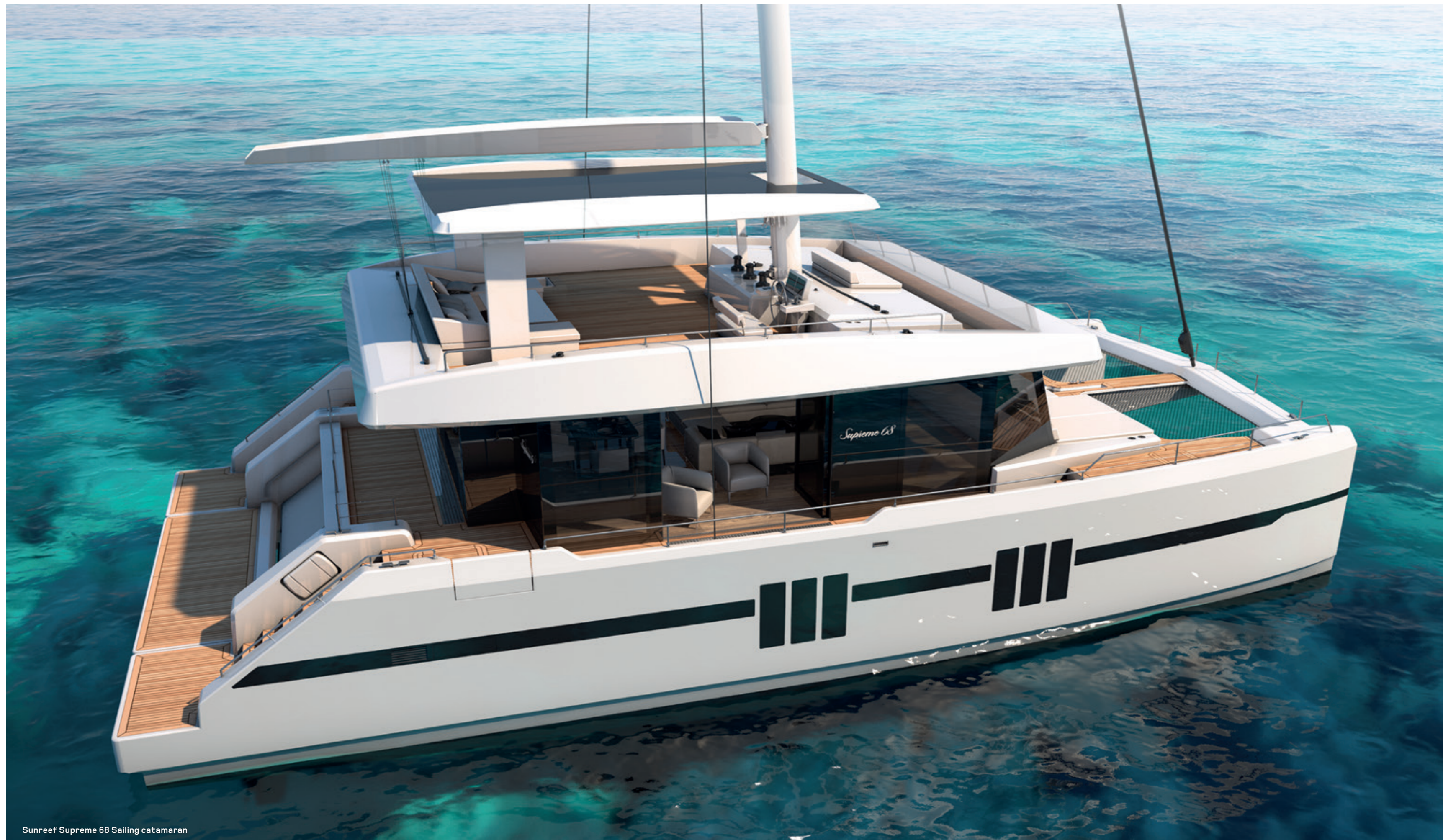
Sunreef Supreme 68 Sailing catamaran

The Sunreef Supreme's architecture revisits the way catamarans have been so far designed. A new, radical concept of the superstructure allows to keep the saloon and exterior deck on the same level. As a result, the Sunreef Supreme 68 boasts an enormous main room surrounded with floor to ceiling glass - a smooth, seamless space opening onto the cockpit and giving direct access to the deck through sliding doors on both sides of the yacht. The exterior and interior surfaces of the boat merge into one panoramic lounging and dining area.