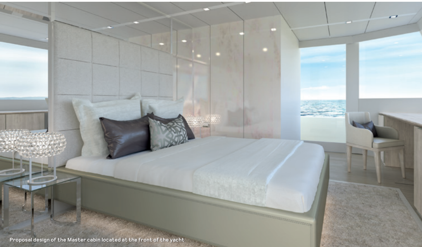
Proposal design of the Master cabin located at the front of the yacht