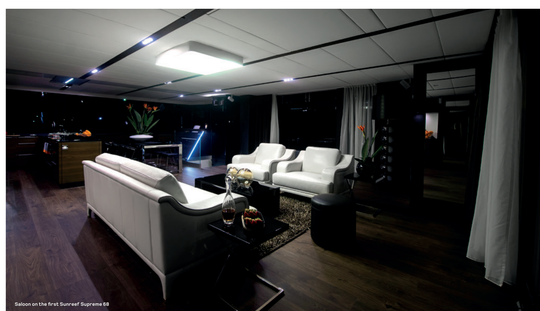
Saloon on the first Sunreef Supreme 68