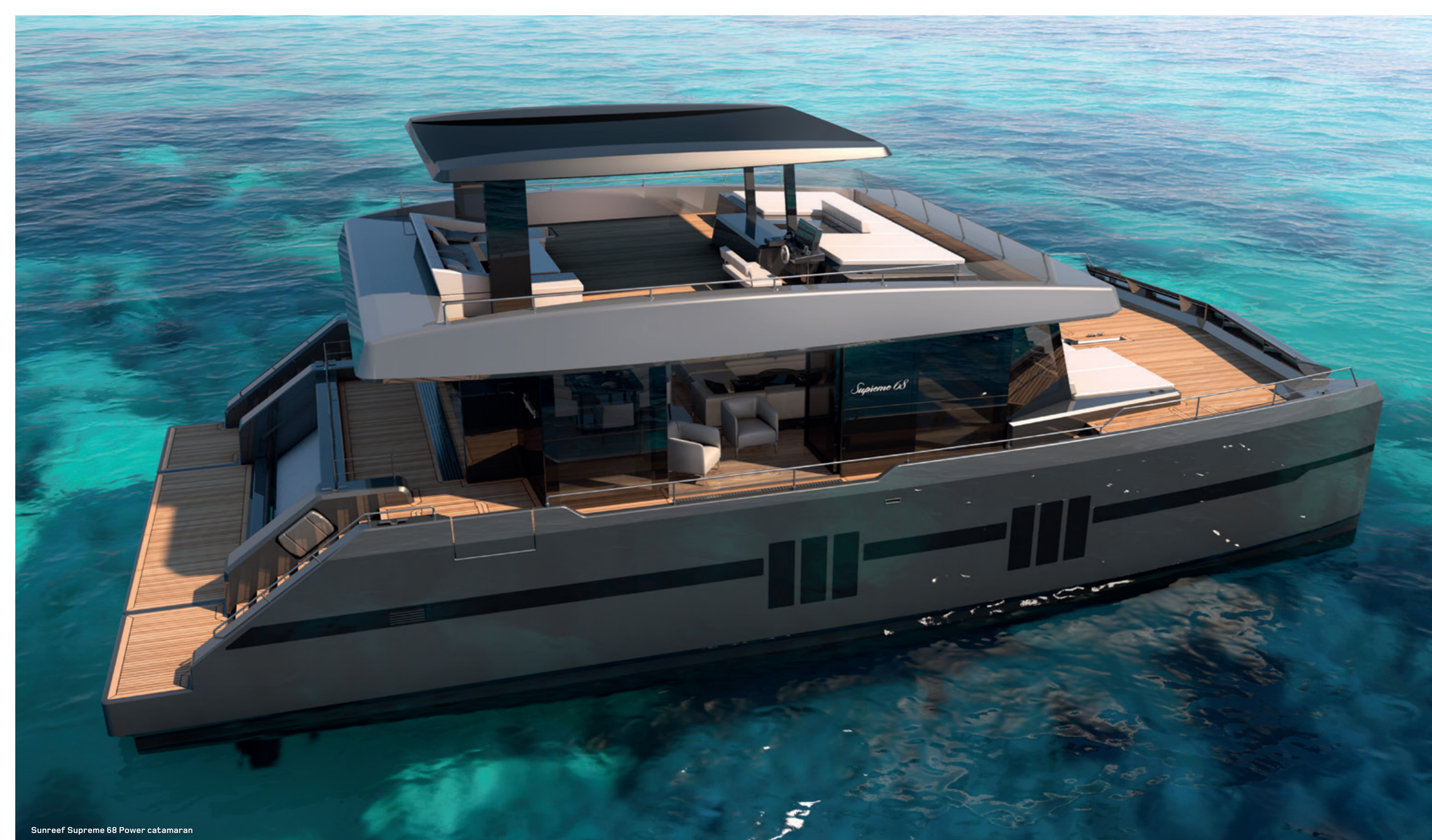
Sunreef Supreme 68 Power catamaran

The power Sunreef Supreme 68 feature a design solution inspired by the motorsport and aeronautical industry. To enhance the yacht's aerodynamic characteristics, a carbon-made v-shaped front spoiler will be installed at the yacht's bow to ensure efficient air movement across the superstructure.