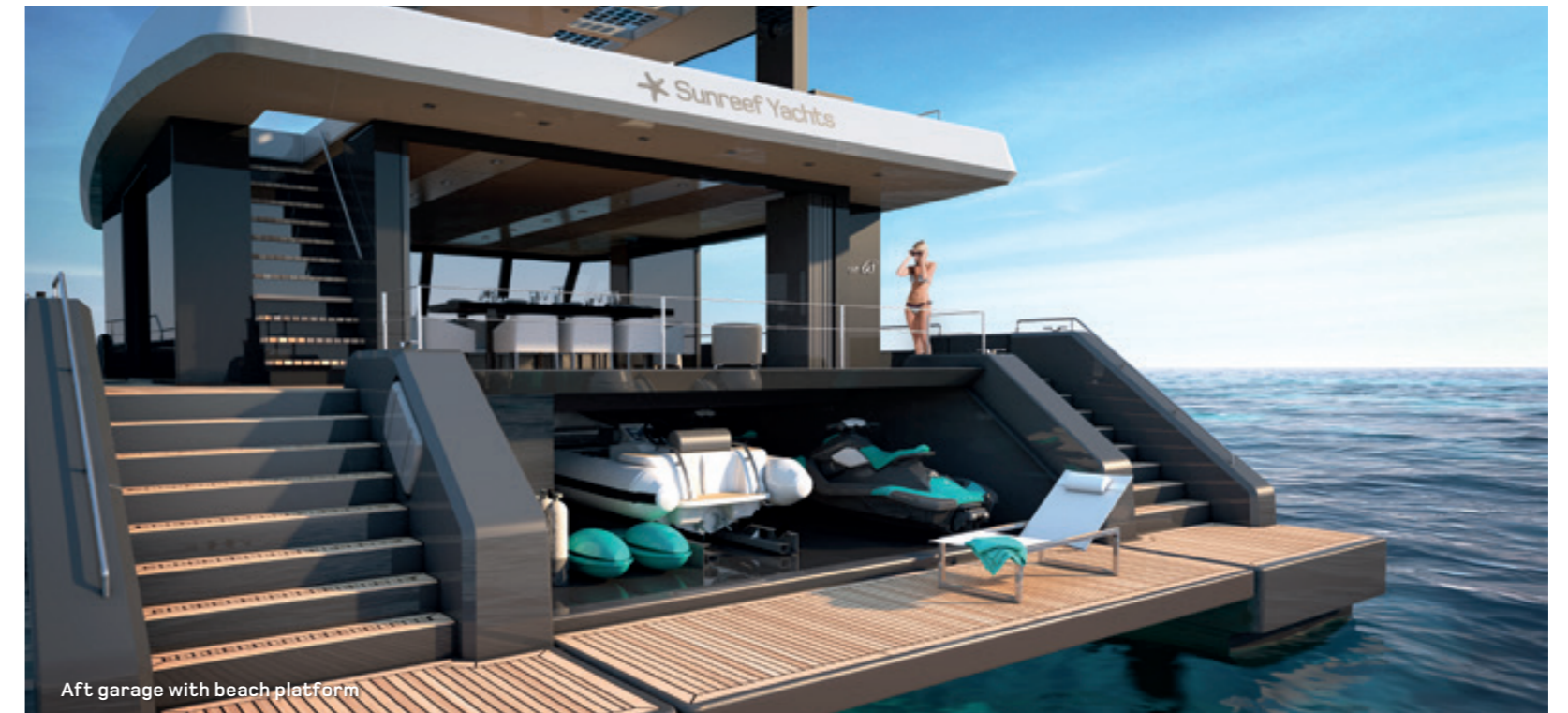
Aft garage with beach platform

Le Sunreef Supreme 68 est équipé d'un garage arrière. Cet espace volumineux permet de ranger aisément une annexe de 5m, deux jet-skis, l'équipement de plongée et les voiles. La porte du garage en position basse, rejoint le niveau de la plateforme arrière pour créer un espace détente et bains de soleil extérieurs.