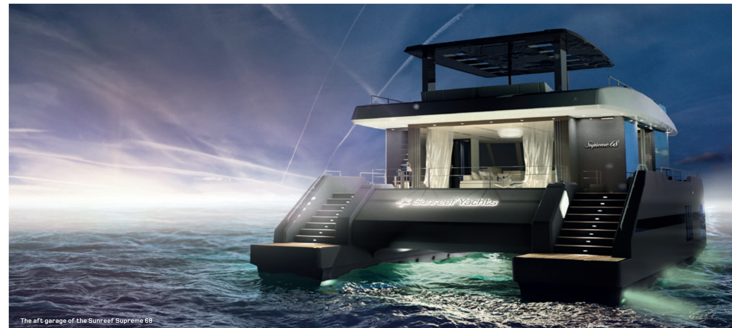
The aft garage of the Sunreef Supreme 68

Le Sunreef Supreme 68 – première mise à l'eau de la gamme Sunreef Supreme, à été présenté lors du Singapore Yacht Show 2016. C'est un catamaran de 68 pieds à voiles avec un espace habitable total de près de 300 m 2 , offrant la surface d'un superyacht sur un yacht de moins de 24 m.