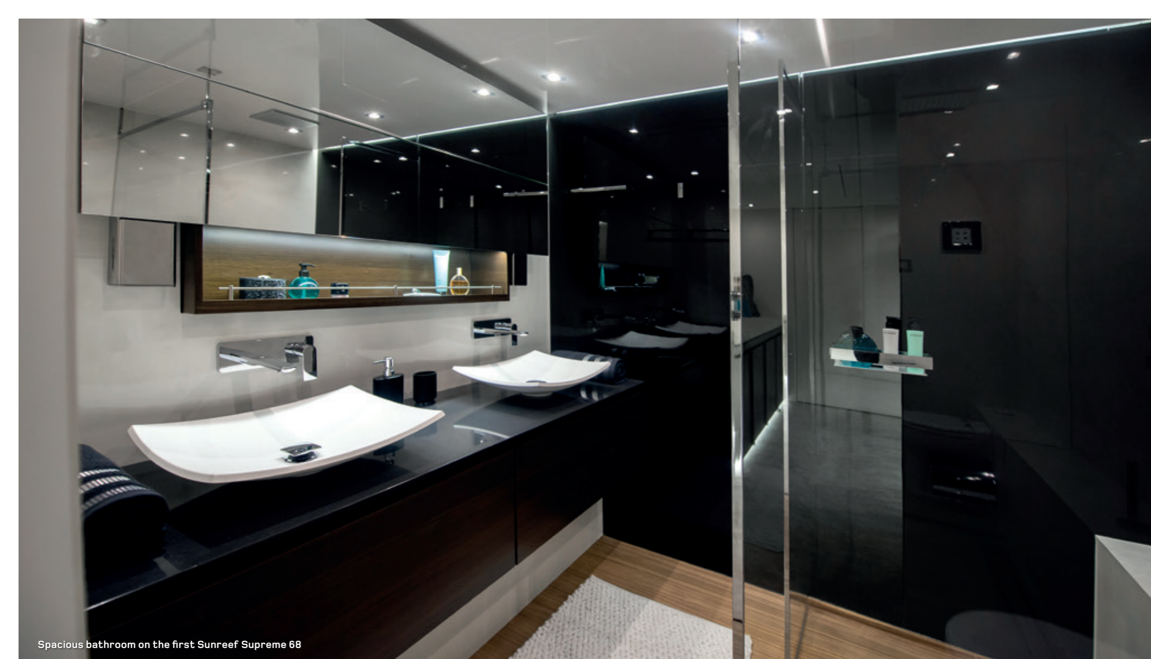
Spacious bathroom on the first Sunreef Supreme 68