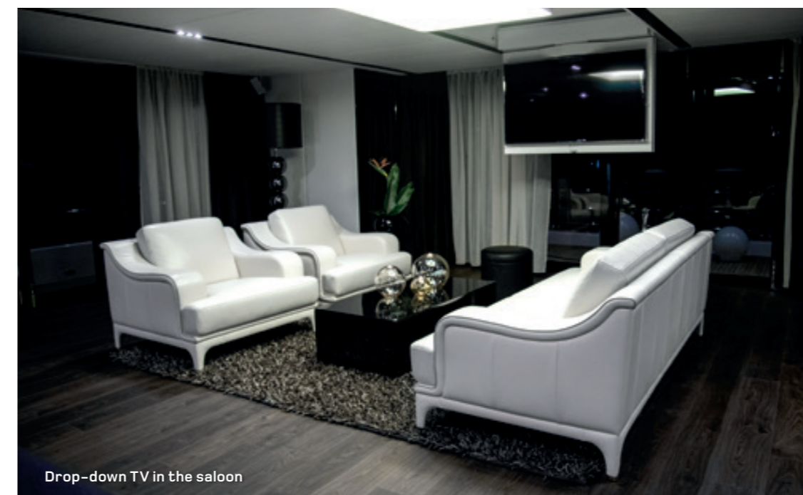
Drop-down TV in the saloon