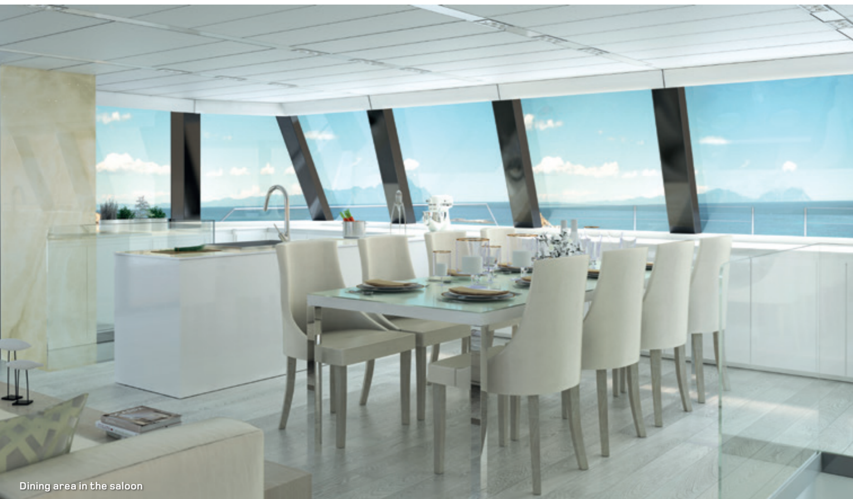
Dining area in the saloon

The front part of the scenic main room, depending on the Owner's choice, can feature an extravagant master suite with a view to the sea and a private dressing room or up to two vip cabins. The arrangement choice for the volume available amidships and on the sides is limitless with enough breadth to house a fully equipped galley, a long dining table, large sofas, a bar, coffee tables and lounging areas.