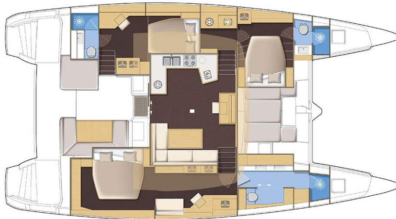
Version 3 cabines / 3 cabin version