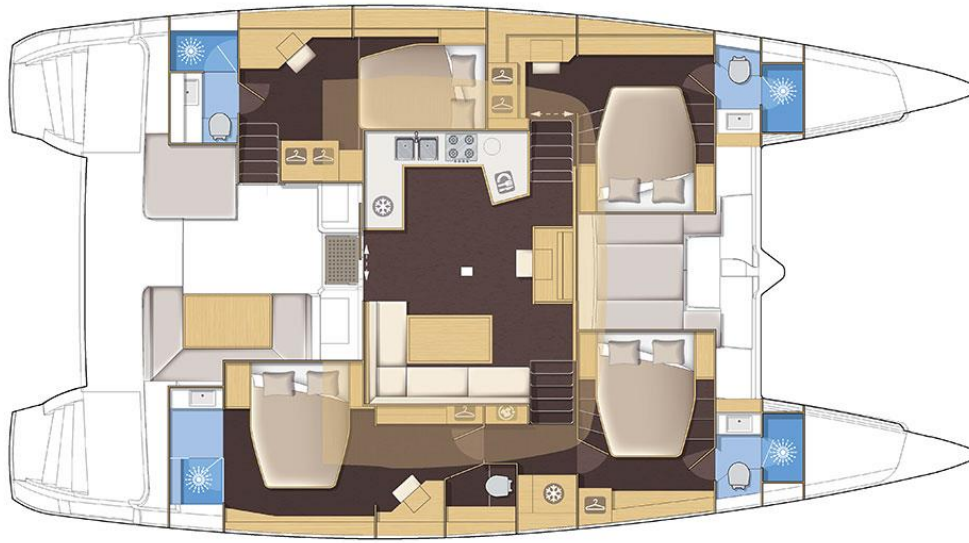
Version 4 cabines / 4 cabin version